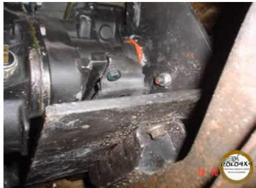
Parte de baixo