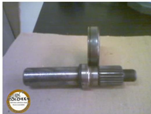
Eixo luva + ponteira