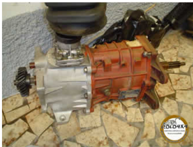
Cambio CL 2205 da C 20

Sua adaptação é super simples uma flange e um eixo feito com a luva do próprio Chevette nada que um bom mecânico não faça.