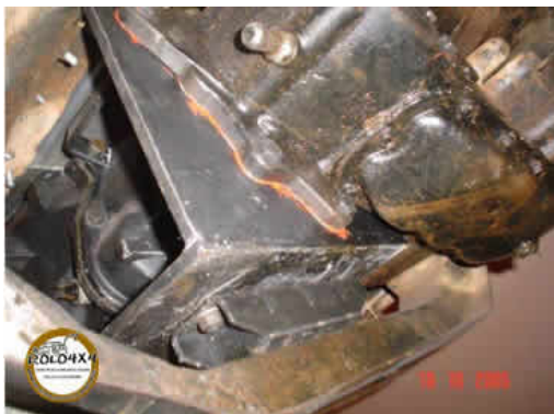
Parte de baixo do Jeep

Agora está convencido e curioso para saber como fica?