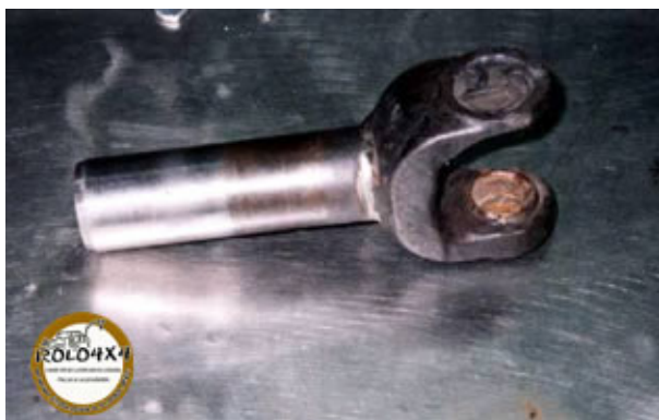
Luva do cardã do Chevette +

Sua adaptação é super simples uma flange e um eixo feito com a luva do próprio Chevette nada que um bom mecânico não faça.