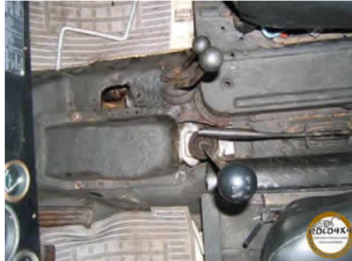
Posição da alavanca

Economizar na manutenção e combustível é como aquele cartão não tem preço, e com esta pincelada sobre a adaptação do batizado por jipeiro que usa o Clarkette sei que vai ter jipeiros que vai querer colocar e jipeiros que não vai acreditar que este cambio funciona segue o link para estudo: